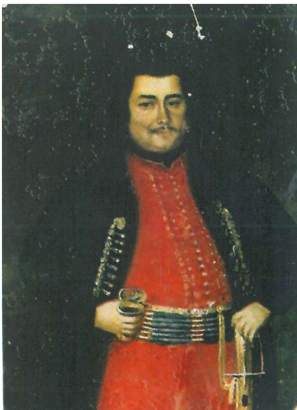
Никола Качамагов – имперски Съветник при Мария Терезия