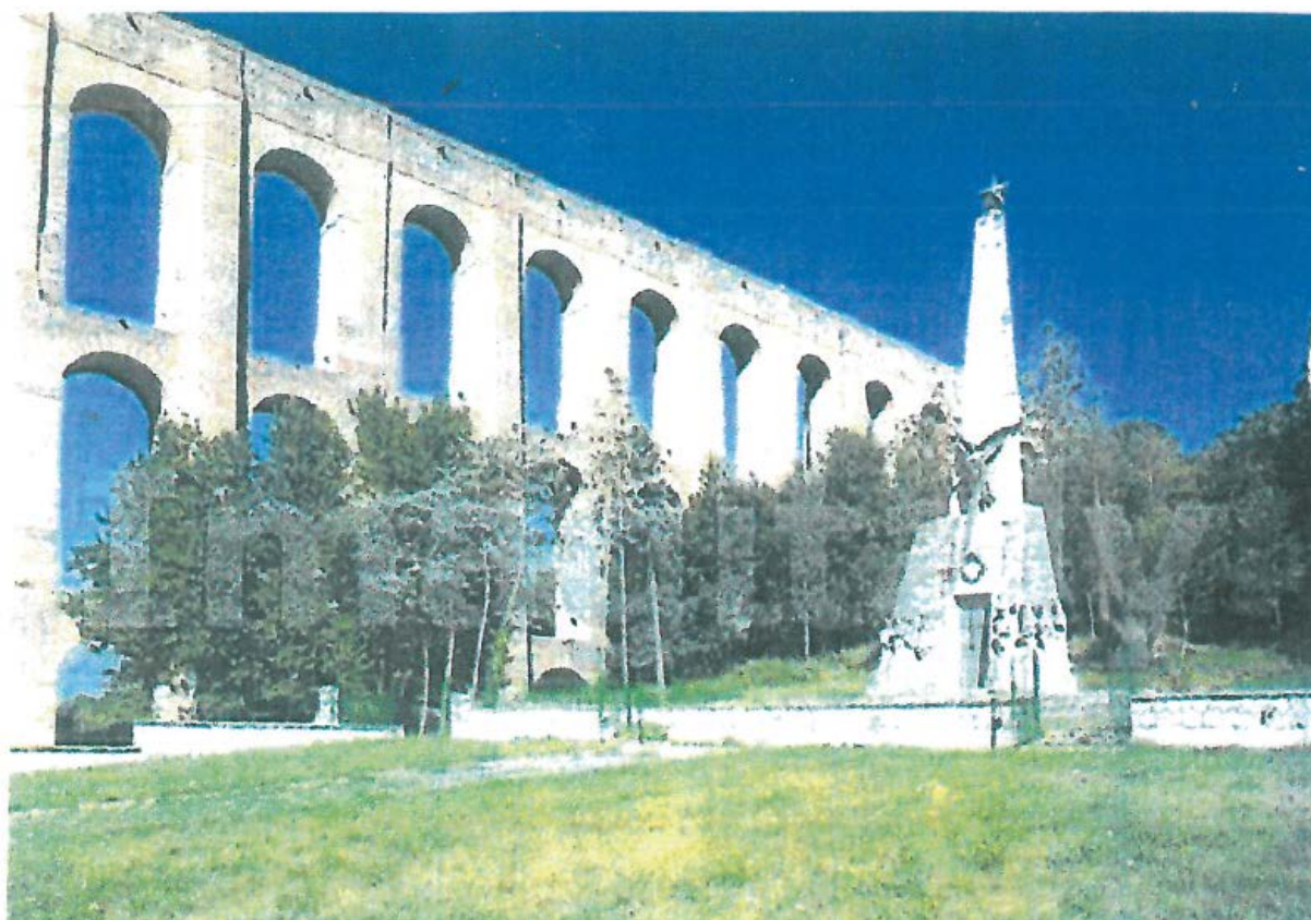
Мост над река Волтурно и паметник на загиналите в битката през 1860 г.