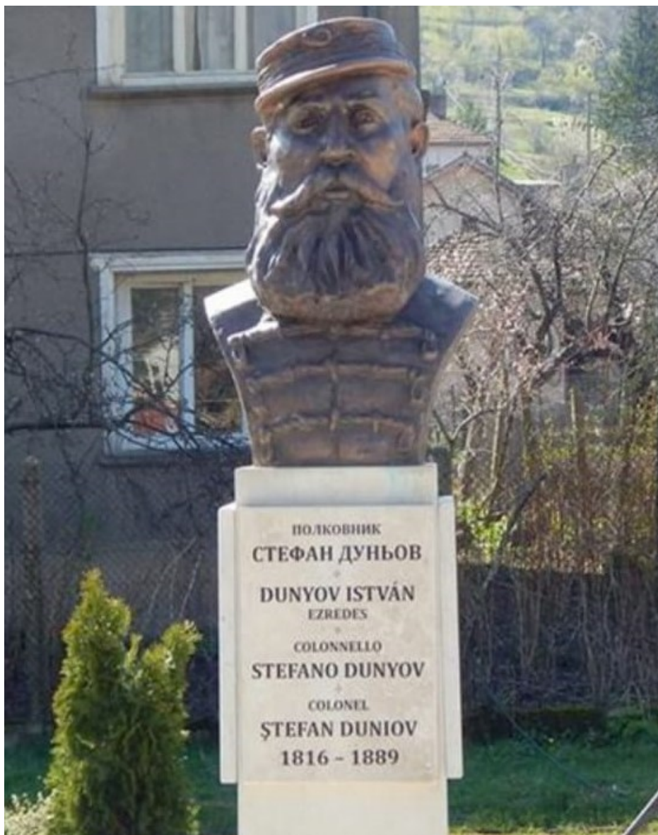
Паметник на Стефан Дуньов в Чипровци