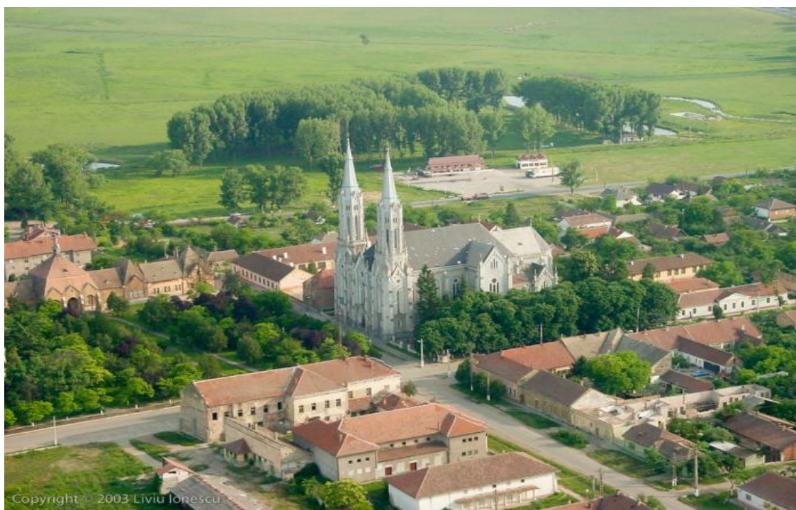
Гр. Винга – родното място на Стефан Дуньов