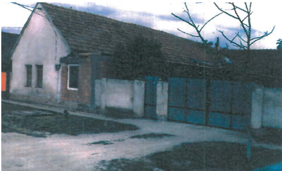
Къщата, в която е роден и живял Стефан Дуньов