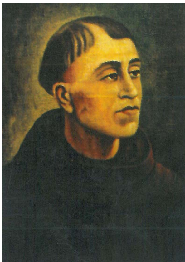
Ферменджин, Еузебие (Мартин)- Първият български академик-винганин